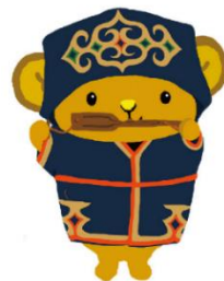
北海道観光PRキャラクター キュンちゃん(イランカラブテ ver.)