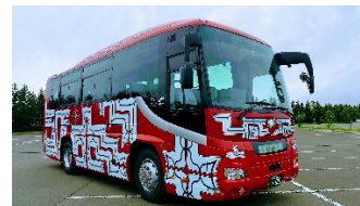
セタプクサ号イメージ