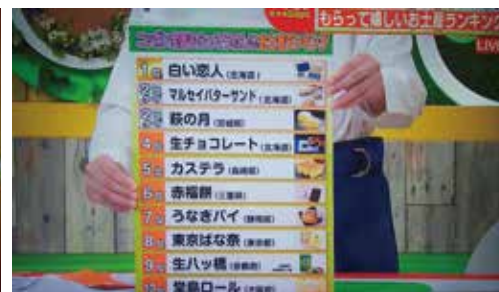
出自東京電視台 2022 年 5 月 25 日播放的《YOJIGOJI Days》